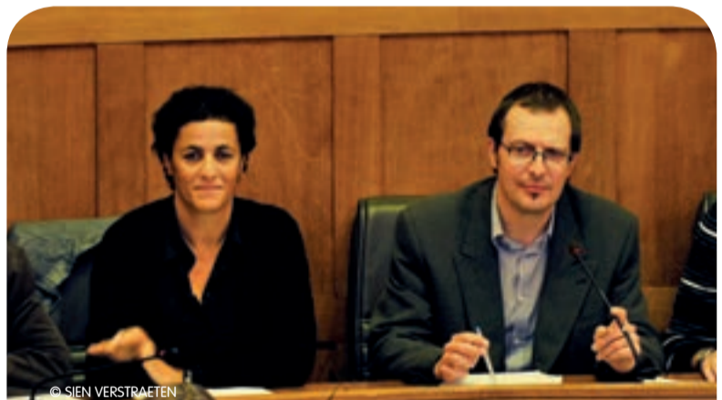
De provinciale fractie is erg kritisch over het kostenplaatje van de buitenlandse activiteiten van de provincie Oost-Vlaanderen